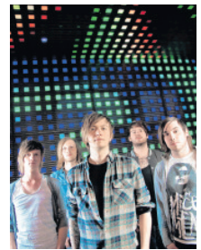
She wants Chaos. EN

ELMSHORN Kurz vor Sommer-Ferienbeginn soll es im Elmshorner Jugend- und Kulturzentrum bereits heiß werden – und zwar richtig heiß. Vier norddeutsche Newcomer treten auf die Bühne. Heimrecht haben beim Halt auf ihrer Deutschlandtour die fünf Jungs der Pinneberger Combo „She wants Chaos“.